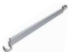
Стержень для предотвращения падения