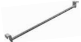
Barre en acier inox ø 15 mm pour accrocher les salamis